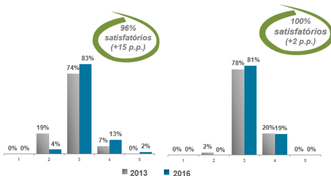
IGC – Índice Geral de Cursos (2013 x 2016)

Com o anúncio dos resultados das áreas de Saúde e Ciências Agrárias, o Grupo Estácio consolida, no ciclo trienal de avaliação 2014-2016 (com todas as áreas do conhecimento avaliadas: Humanas, Exatas e Saúde) com índice elevado de notas positivas. Desde 2014, as avaliações superaram 95% de aproveitamento: